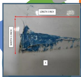
Nose Radome hit by Maintenance Stair CoPQ: USD 7000

Sepanjang tahun 2021 hingga awal bulan Januari tahun 2022, terdapat 4 Ground Incident terkait dengan tangga kerja yang menabrak pesawat sehingga menyebabkan kerusakan pada pesawat. Seluruh Ground incident tersebut terjadi pada saat proses movement tangga kerja yang dilakukan oleh 1 orang sehingga mengakibatkan kurangnya awareness dan terbatasnya pandangan ( visual ).