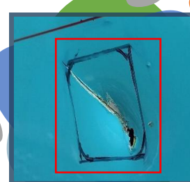
Fuselage hit by Maintenance Stair CoPQ: USD 2000